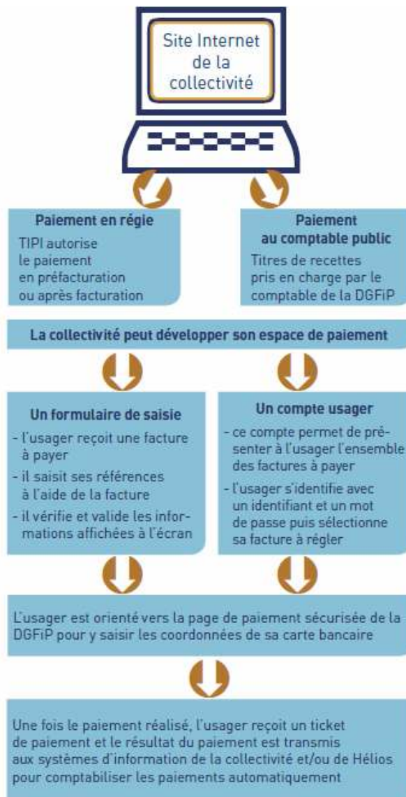
Schéma de fonctionnement